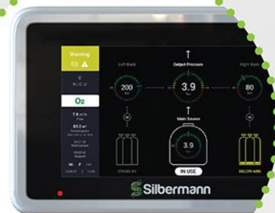
Detección de fugas