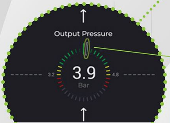
Puesta en marcha sencilla