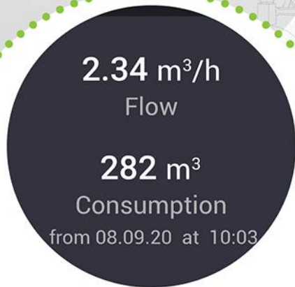
Flujo y Consumo