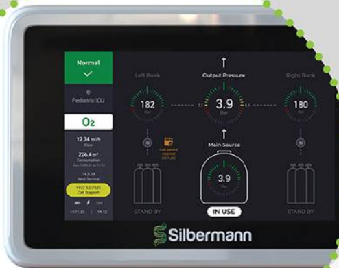
Alerta de fecha de caducidad del gas